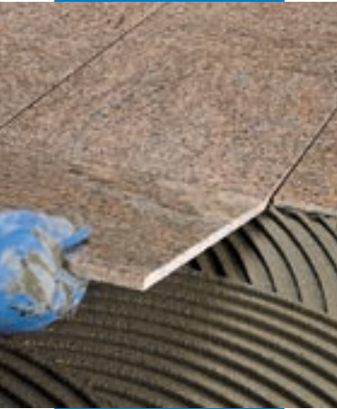
Pose de marbre poli en sol