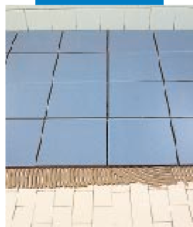
Superposition de carrelage existant avec Keraflex gris