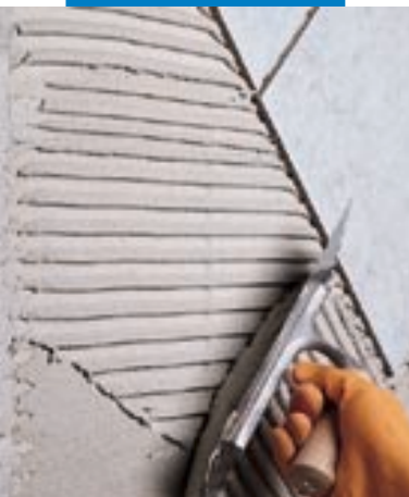
Pose de carrelage en murs, sur béton cellulaire