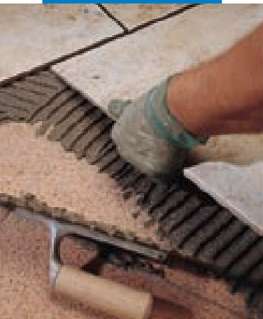
Collage de carrelage sur anciennes dalles ciment